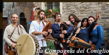
La Compagnia del Coniglio